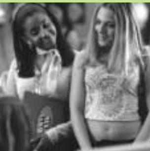
Degrassi: The Next Generation

Cette série d'animation 3-D pour enfants de 5 à 10 ans met en scène un garçon qui se transforme en monstre de 7 pieds de haut chaque fois qu'il éternue.