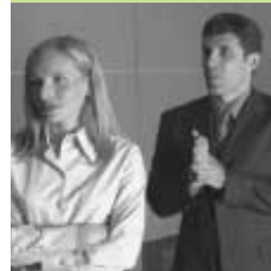
The 11th Hour