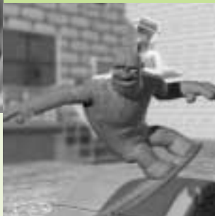
Monster by Mistake