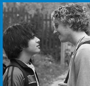
Degrassi : The Next Generation