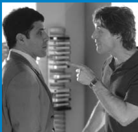
The 11th Hour