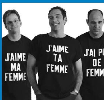
Hommes en quarantaine