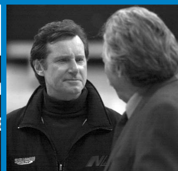
Lance et compte : la reconquête