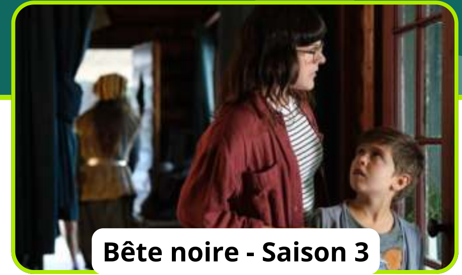
Bête noire - Saison 3

À Port-Menier, seul village d'Anticosti, Justine Gamache revient pour la première fois en sept ans après le succès de son roman. Son arrivée coïncide avec des tensions autour d'un projet hôtelier en pleine forêt. Mais tout bascule lorsqu'on retrouve Sophie Pelletier morte au pied de la chute Vauréal. Les policiers concluent au suicide, mais les insulaires rejettent en bloc ce verdict. Justine s'associe alors au garde-chasse Michael Mackenzie pour découvrir la vérité.