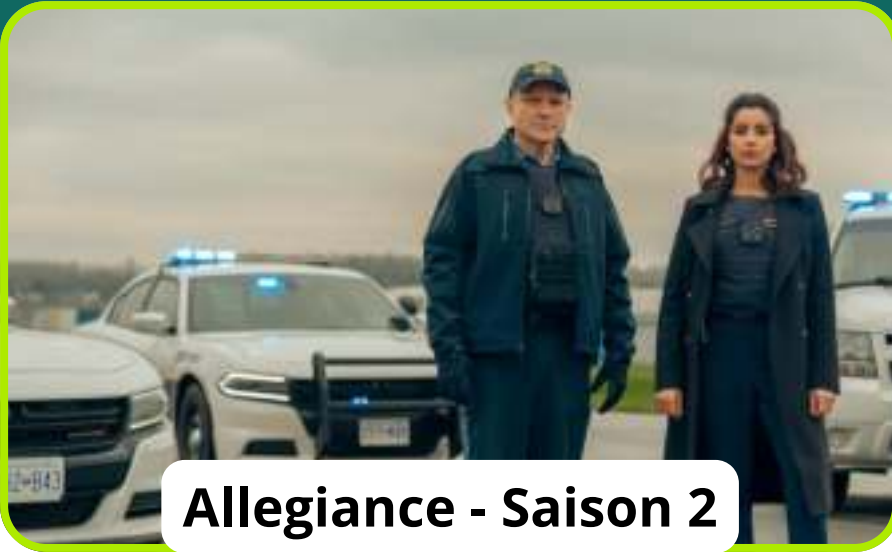
Allegiance - Saison 2