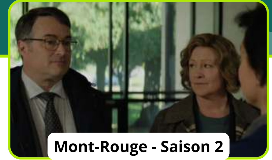
Mont-Rouge - Saison 2

Sous ses allures d'adolescent de 16 ans, Liam est un humanoïde conçu en secret au Laboratoire d'Intelligence Artificielle Mondial. Ayant développé volonté propre et émotions, il refuse sa mission : asservir l'humanité. Traqué par son créateur, le Dr Wood, Liam doit fuir avant une attaque prévue lors de l'Expo-Sciences universelle. Aidé par Rafaële et un groupe d'adolescents, il devra échapper au Dr Wood, déjouer son complot et percer le secret de la forêt de Belmont.