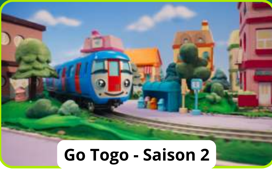
Go Togo - Saison 2