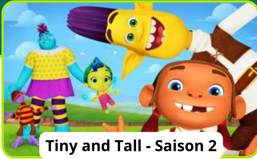
Tiny and Tall - Saison 2